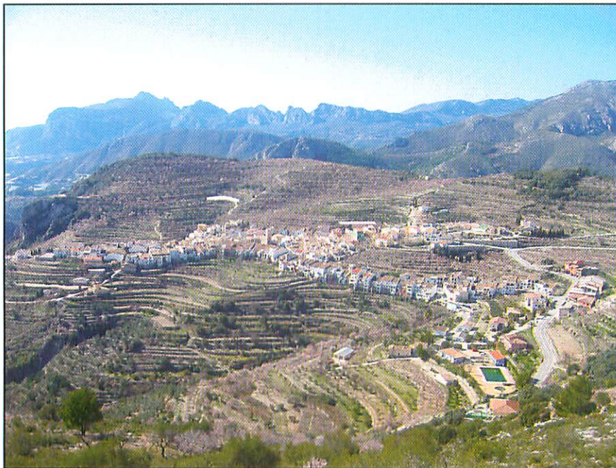
Tàrbena vista des de sa Caseta des Moros