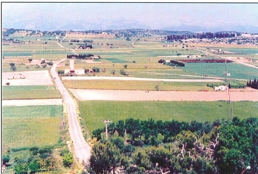
Les Sorts de Santa Margalida, vistes des del Mirador de l'Església