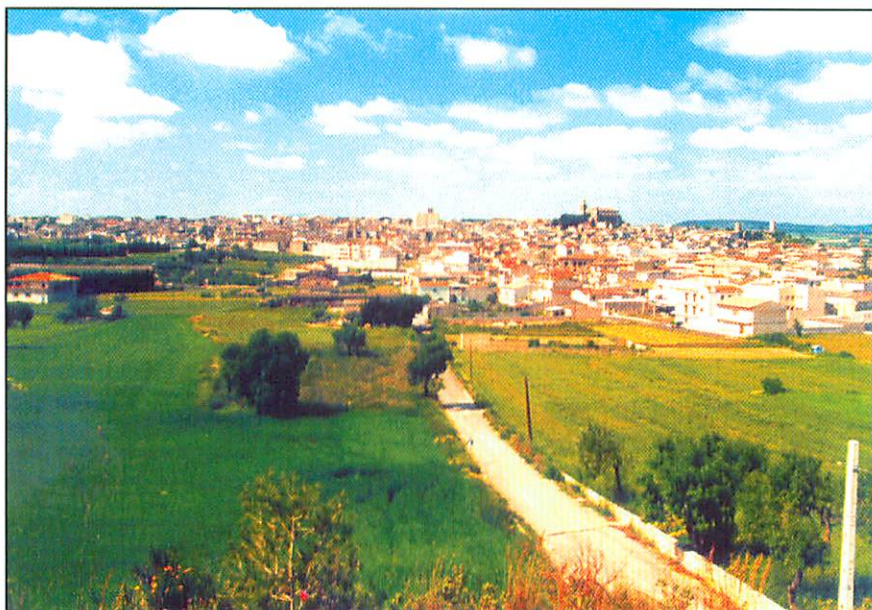
La vila de Santa Margalida vista des de sa Capella i Son Niu